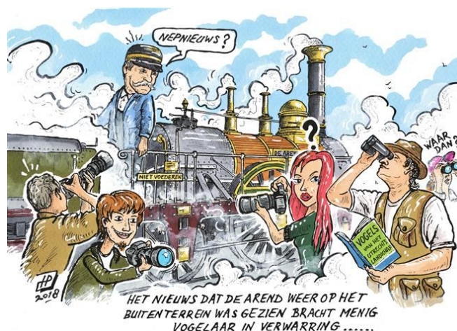
Cartoon van Hans Proper

De weersverwachtingen voor april zien er echter veelbelovend uit zodat we kunnen aannemen dat het festijn doorgaat. Verder geplande rijdagen zijn 19, 20 en 21 mei.