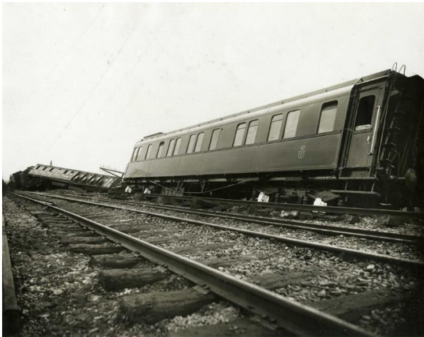
Foto: het treinongeval in Houten 1917