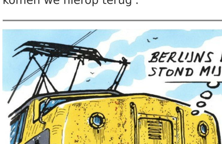
De Blauwe Engel

Op 27 juni beleven wij onze jaarlijkse Vriendendag/Algemene Ledenvergadering . Dit jaar gaan we rijden met het met '46 museumtreinstel 273 en zijn we de gast bij de Stoomtrein Katwijk-Leiden. Nadere bijzonderheden over de reis en de beschikbaarstelling van de vergaderstukken leest u in de VriendenDienst-digitaal van mei en uiteraard ook op onze website.