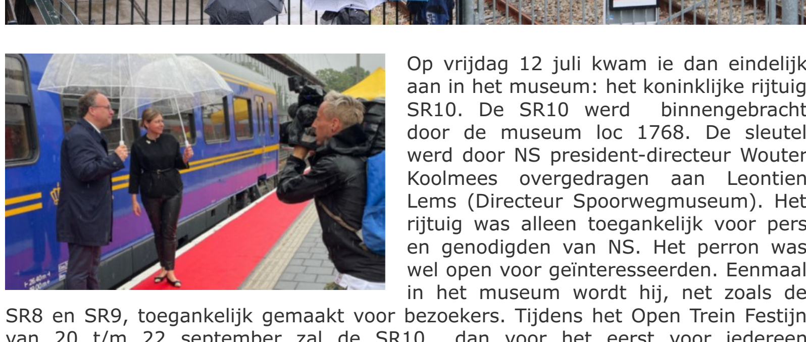
SR8 en SR9, toegankelijk gemaakt voor van 20 t/m 22 september zal de SR10 dan voor het eerst voor iedereen toegankelijk zijn.

Op vrijdag 12 juli kwam de koninklijke rijtuig SR10 in het museum: het koninklijke rijtuig SR10. De SR10 werd binnengebracht door de museum loc 1768. De sleutel werd door NS president-directeur Wouter Koolmees overgedragen aan Leontien Lems (Directeur Spoorwegmuseum). Het rijtuig was alleen toegankelijk voor pers en genodigden van NS. Het Perron was wel open voor geïnteresseerden. Eenmaal in het museum wordt hij, net zoals de bezoekers. Tijdens het Open Trein Festijn dan voor het eerst voor iedereen toegankelijk.